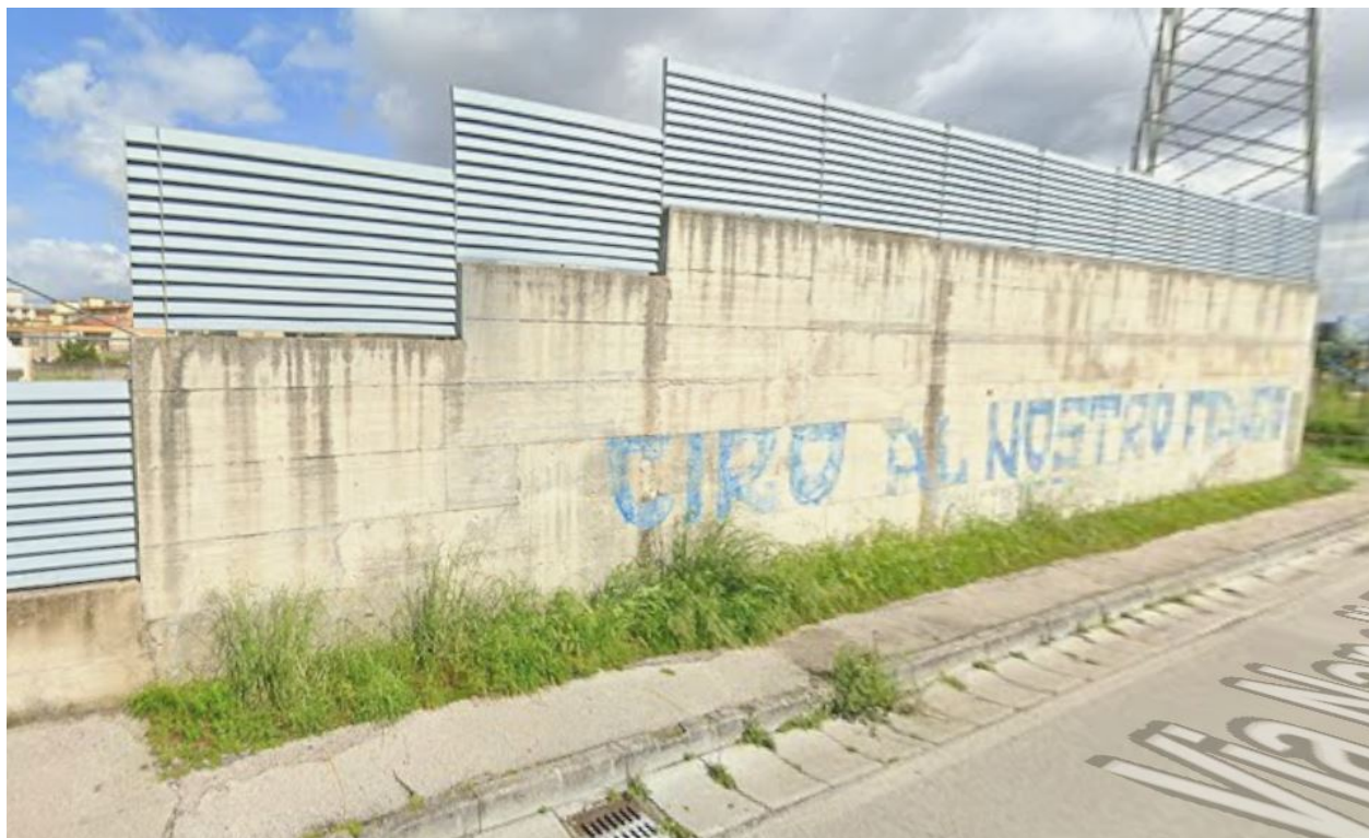
Immagine n. 3 – Vista frontale SUPERFICIE 2